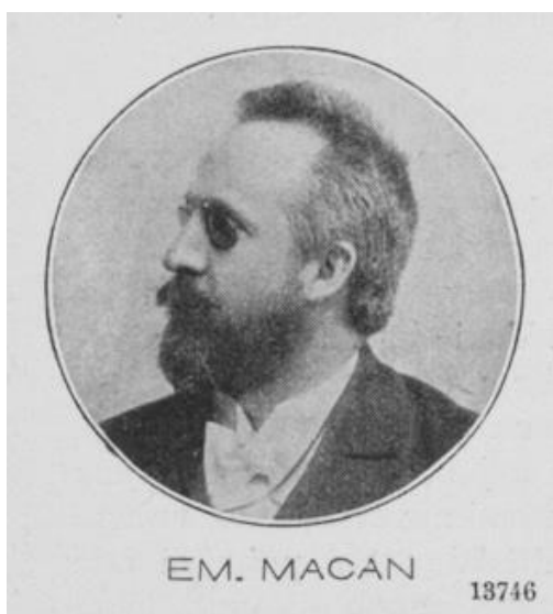
Portrét veľikána z roku 1903