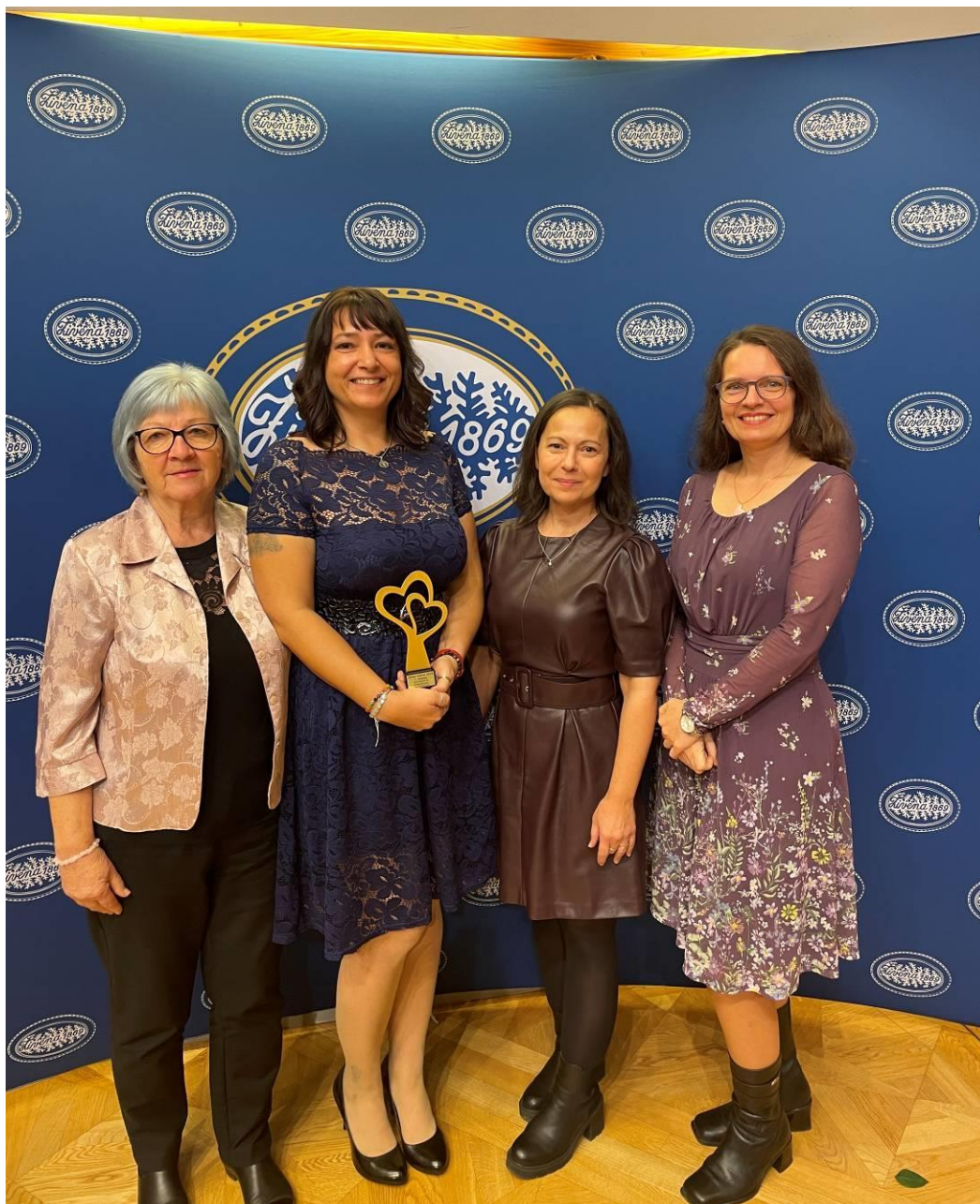
Žena roka 2025 s kolegyňami z ÚNSS

(úsmev)! Keď sa, hoci v mysli, prejem po mestách stredného Slovenska, vidím svoj rukopis a som pyšná na to, čo som dokázala. A z čoho mám rovnako veľkú radosť ako z ocenenia, je fakt, že sa téma sprístupňovania prostredia opäť dostala na prvé stránky a že si ľudia uvedomili, že debarierizácia, to nie sú len znížené obrubníky a rampy. Je to výborná reklama a ja dúfam, že to povzbudí ďalších projektantov a zhotoviteľov, aby sa na mňa obrátili.