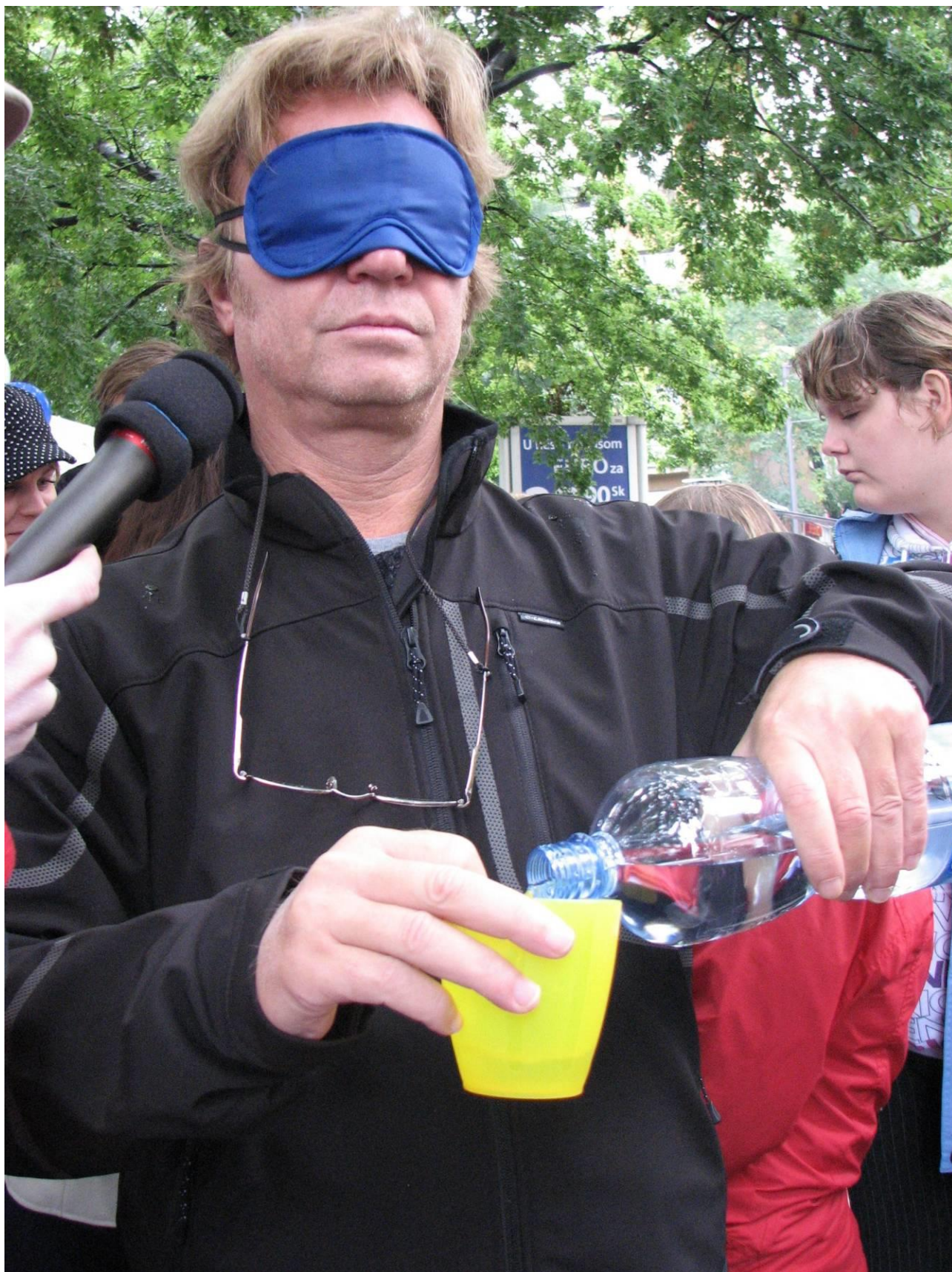
V informačnom stánku v Bratislave sa v roku 2008 zastavil aj obľúbený herec Maroš Kramár