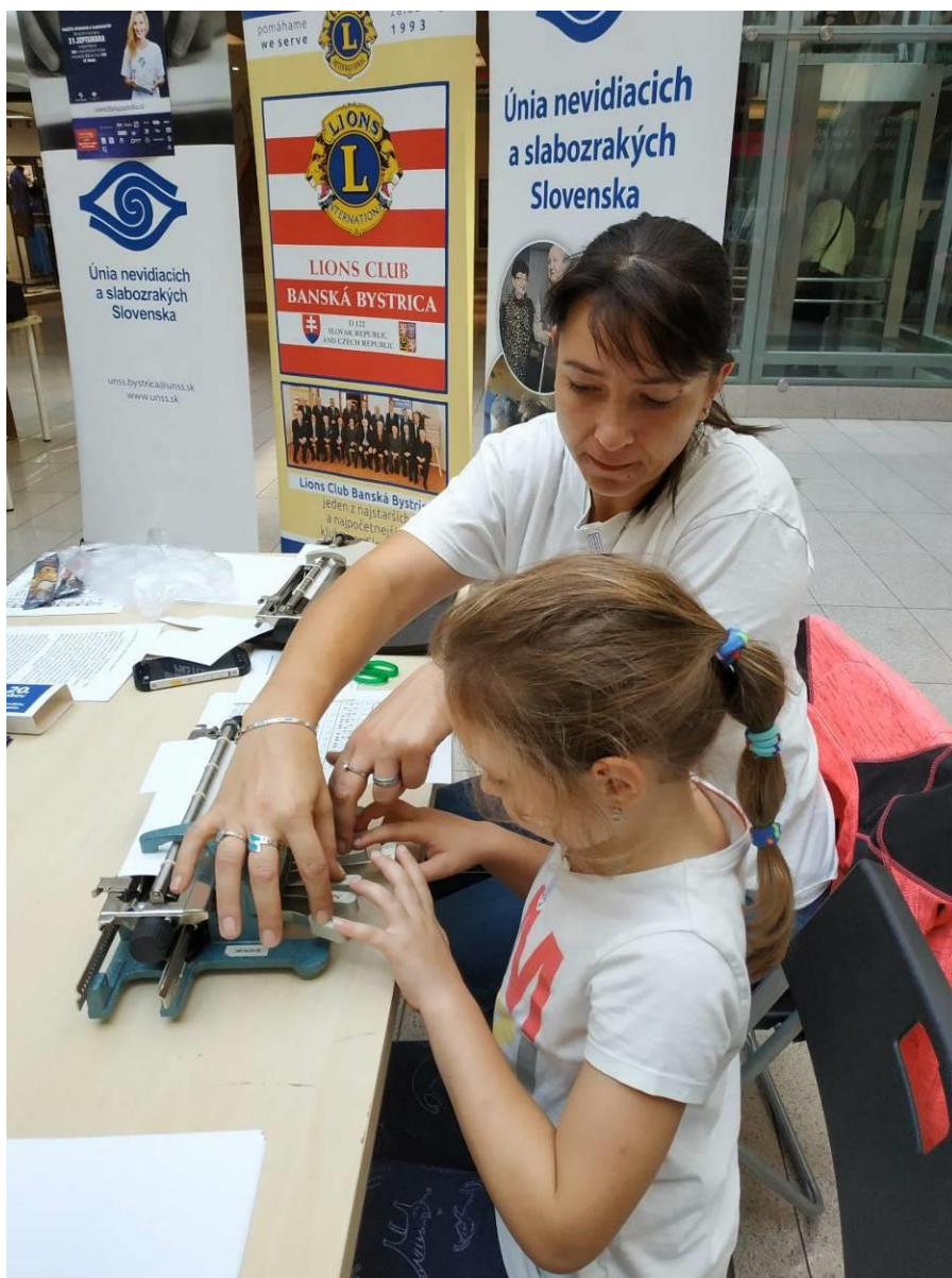
Šifra pána Braila v informačnom stánku Bielej pastelky