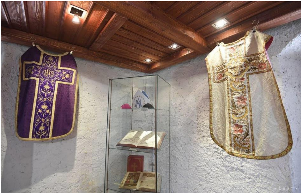
Kňazské rúcha na výstave v Urbanovej veži

V Kostole sv. Michala sú zvukové nahrávky pripravené takisto, QR kódy hľadajte v krypte (pôvodne bol sakrálnou stavbou s kostnicou), v Biskupskom paláci napríklad v audienčnej sieni, v kaplnke areálu na chóre. Celkovo bude v rámci projektu VIA CASSOVIENSIS a DAR OD KRÁĽA – DONUM REGIS osadených 20 tabúľ s QR kódom.