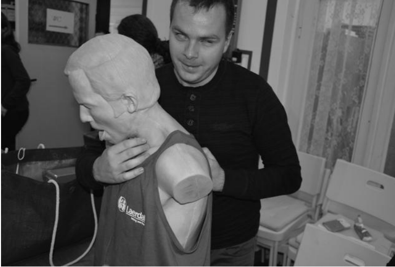
Záchrana pri dusení.