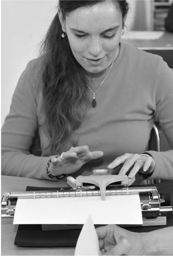
Pribudli nové disciplíny.